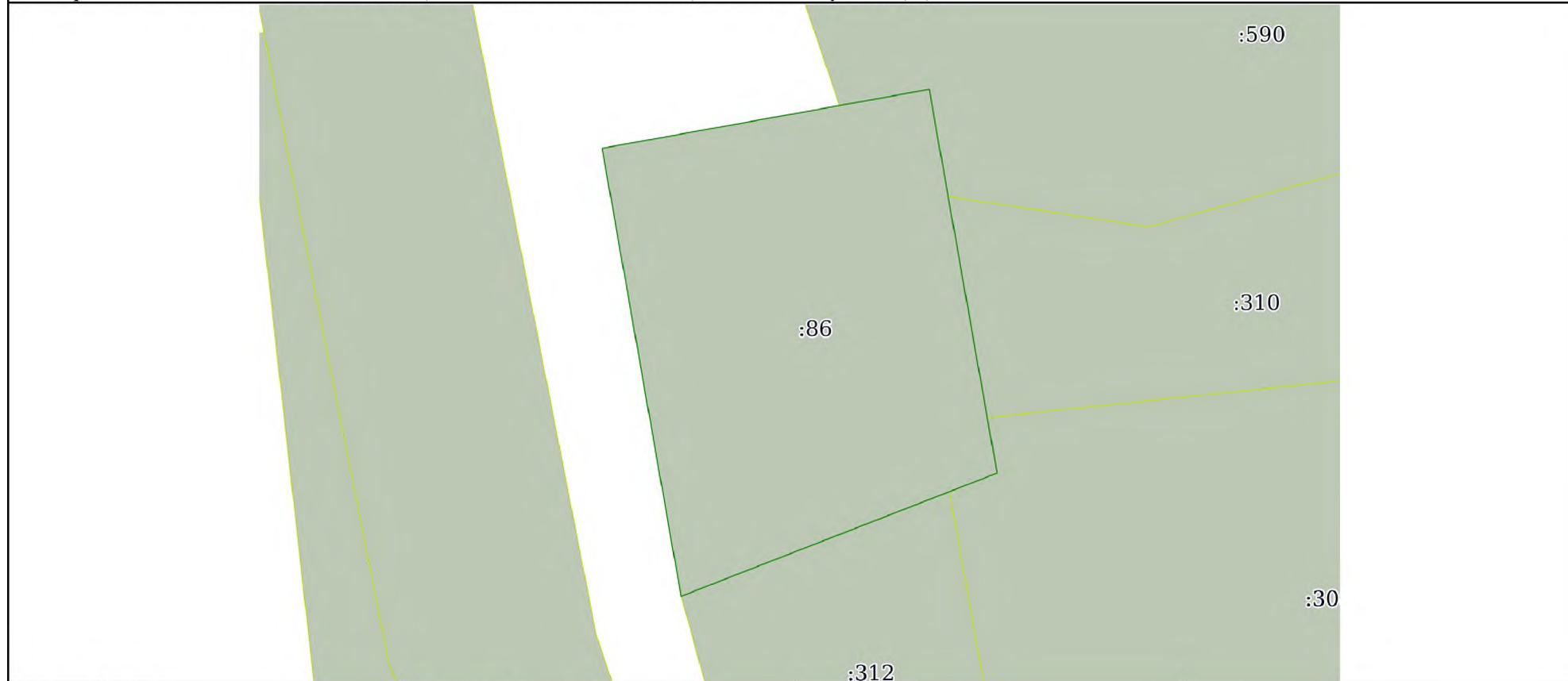
Схема расположения объекта недвижимости (части объекта недвижимости) на земельном участке(ах)