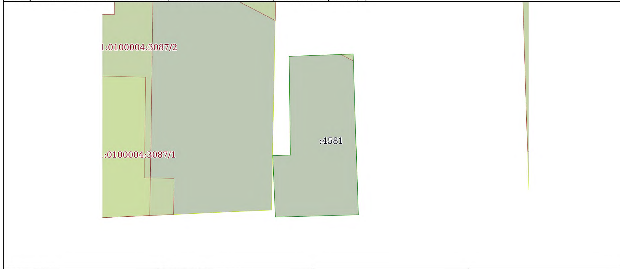
Схема расположения объекта недвижимости (части объекта недвижимости) на земельном участке(ах)