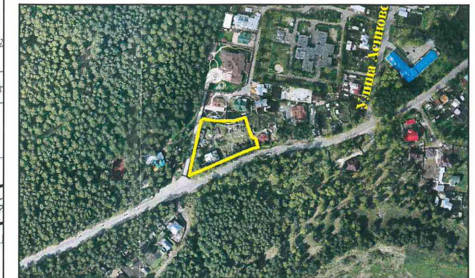
Ситуационный план 1:5000

Учетный номер 70:21:0100003:2758 Оформленные права на земельный участок 1. Лица не было Обременения (сервитуты), ограничения нет (подпись) (дата) 2016 г.