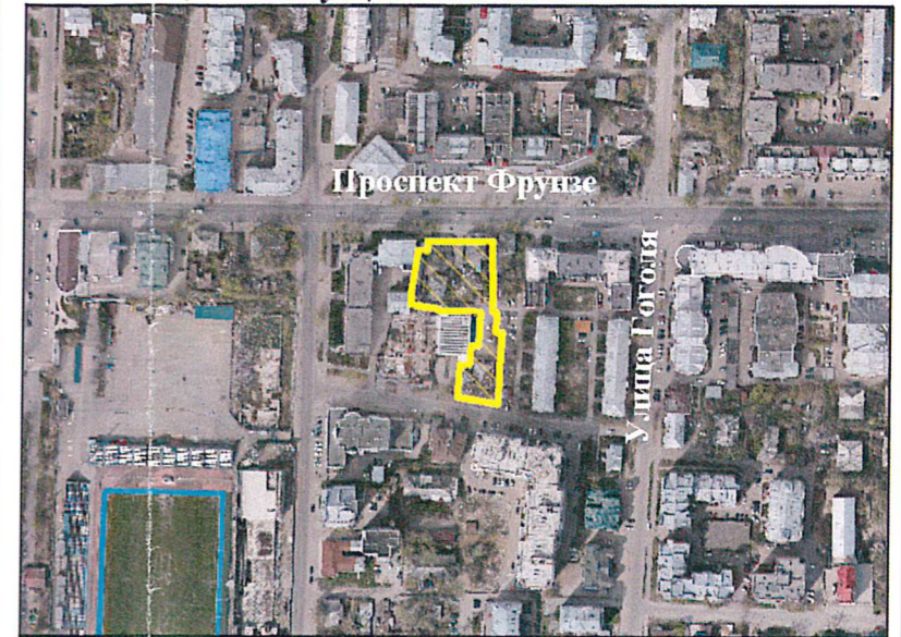
Ситуационный план 1:5000

Площадь территории составляет 3 130 кв.м Граница территории (:ЗУ1) проходит по характерным точкам 1, 2, 3, 4, 5, 6, 7, 8, 9, 10, 11, 12, 13, 14, 15, 16, 17, 18, 19, n1, n2, n3, n4, n5, n6, n7, 21, 22, 23, 24, 25, 26, 27, 28, 29, 30, 31, 32, n8, n9, 1; 33, 34, 35, 36, 37, 38, 33; 39, 40, 41, 42, 39 Часть территории (ЗУ1/чзу1), площадью 2582 кв.м., проходит по характерным точкам 1, 2, 3, 4, 5, 6, 7, 8, 9, 10, 11, 12, 13, 14, 15, 16, 17, 18, 19, n1, n2, n3, n4, n10, n11, 43, n7, 21, 22, 23, 24, 25, 26, 27, 28, 29, 30, 31, 32, n8, n9, 1; 33, 34, 35, 36, 37, 38, 33 - зона регулирования застройки и хозяйственной деятельности (ЗРР 4-31) Часть территории (ЗУ1/чзу2), площадью 548 кв.м., проходит по характерным точкам n4, n5, n6, 20, n7, 43, n11, n10, n4; 39, 40, 41, 42, 39 - расположена в зоне регулирования застройки и хозяйственной деятельности (ЗРР 1-53)