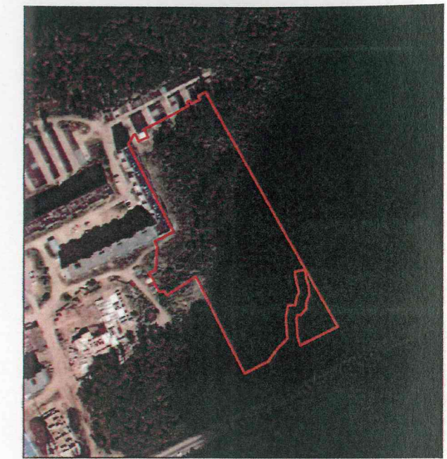
Ситуационный план 1:5000